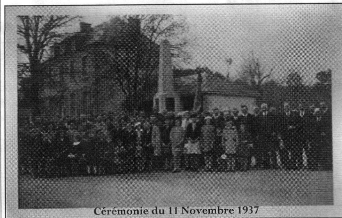
Cérémonie du 11 Novembre 1937